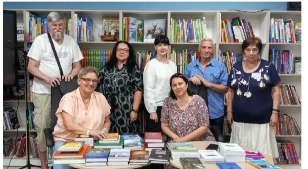
Общая фотография на память