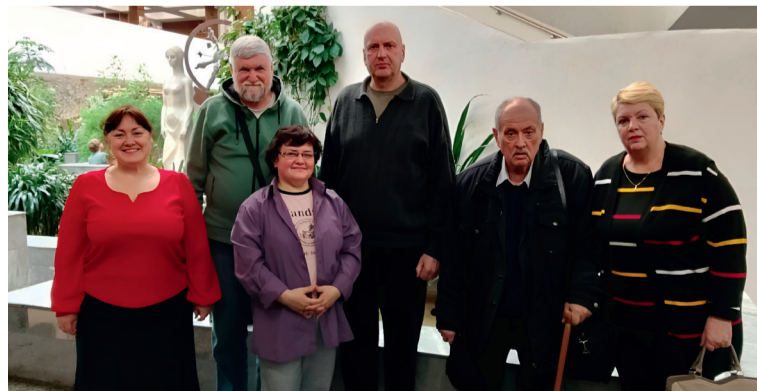
Семинар 15 марта 2026 г.

15 марта 2026 года в Донской государственной публичной библиотеке состоялось очередное семинарское занятие группы прозаиков.