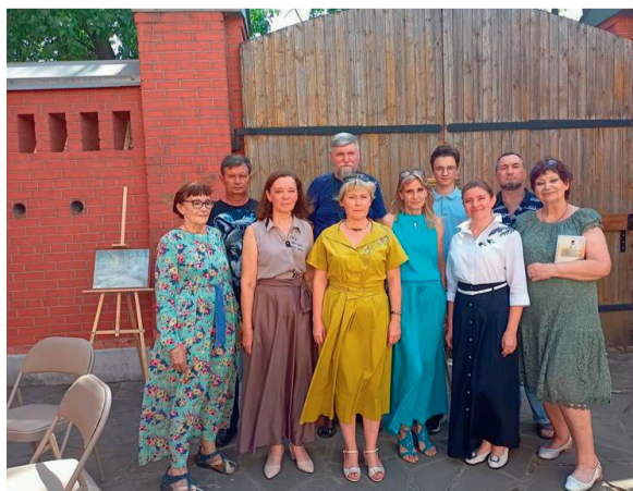
Писатели после творческой встречи в Лавке Чеховых в Таганроге

Встреча их произошла 130 лет назад в Ясной Поляне, где Лев Нико-