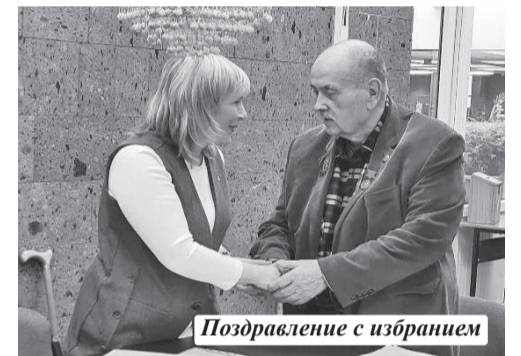
Поздравление с избранием