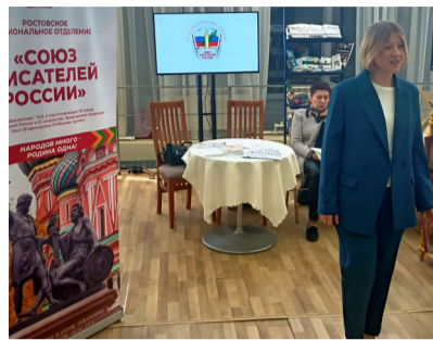
Площадка РРО СПР

Писатели блестяще выступили перед гостями со своими стихами, посвящёнными народам России, их вековой дружбе, созидательству, любви и преданности единой