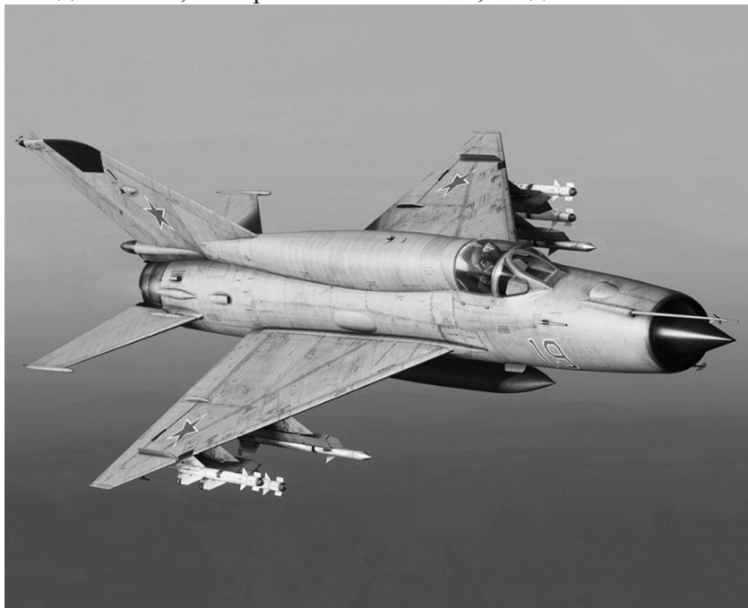
Всепогодный перехватчик МиГ-21.

Надо сказать, что практически все мы, солдаты-механики на-