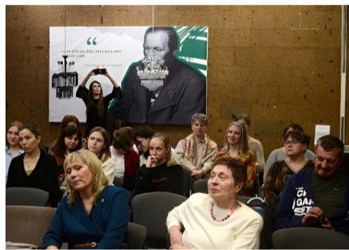
Встреча с финалистами