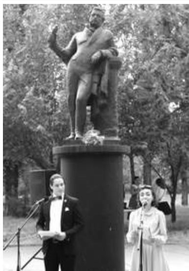
Праздник Пушкина в Таганроге

В начале июня традиционно во многих городах Ростовской области отметили Пушкинские дни.