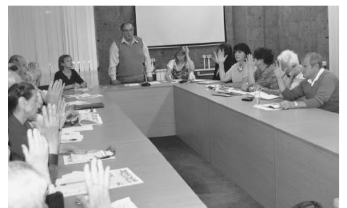
На съезде ВЛС