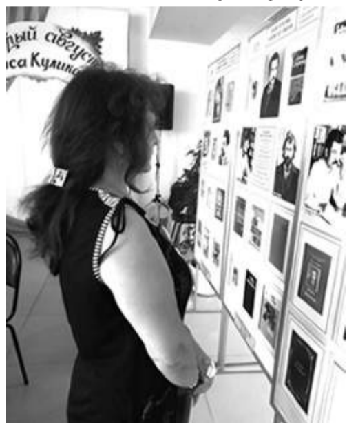
Экспозиция в честь 80-летия Б. Куликова

Но заключительным аккордом прозвучали её слова: «У вас не будет зрителей...» На что я ответил: «Да, если вы постараетесь, зрителей у нас, конечно, не будет. Но если наше участие вам так не нравится, мы можем вообще не приезжать и отметить юбилей Куликова в Донской публичной библиотеке — там у нас зрителей будет достаточно...»