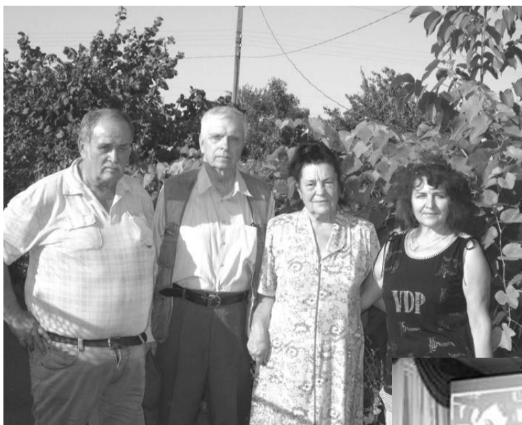
В усадьбе Б. Н. Куликова

28 августа 2017 года исполнилось 80 лет со дня рождения выдающегося донского прозаика и поэта Бориса Николаевича Куликова.