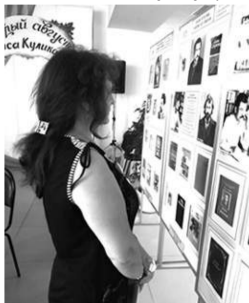
Экспозиция в честь 80-летия Б. Куликова

Но заключительным аккордом прозвучали её слова: «У вас не будет зрителей...» На что я ответил: «Да, если вы постараетесь, зрителей у нас, конечно, не будет. Но если наше участие вам так не нравится, мы можем вообще не приезжать и отметить юбилей Куликова в Донской публичной библиотеке — там у нас зрителей будет достаточно...»